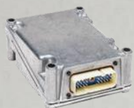
ELEKTRONICZNA JEDNOSTKA STERUJĄCA (ECU)