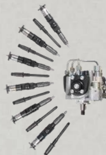
WTRYSKIWACZE, POMPY WTRYSKOWE